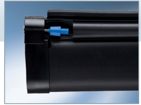
Prinzip Quetschverbindung Optima-Plus-Verschraubung

Die Auswerterelektronik überwacht die mit einem Abschlusswiderstand ausgestattete Sicherheitsleiste nach dem Ruhestromprinzip. Durch die Sicherheitsleiste fließt ein durch den Widerstand (8,2 k \Omega ) definierter Strom. Sinkt der Widerstand durch mechanischen Druck auf die Sicherheitsleiste auf < 5,5 k \Omega , wird dies als Betätigung (Auswerterelektronik: LED ROT) erkannt. Eine Erhöhung des Widerstandes der Sicherheitsleiste durch Übergangswiderstände oder Kabelbruch auf > 11,5 k \Omega wird als Kabelbruch bzw. Störung (Auswerterelektronik: LED GELB) erkannt. In beiden Fällen stoppt die Anlage (Auswerterelektronik: Sicherheitsrelais K1 und K2 öffnen).